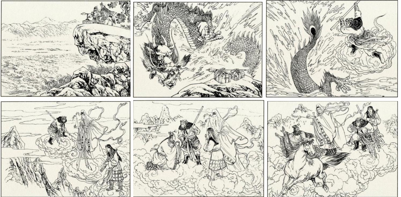
《西游记》悟空戴上紧箍咒，白龙化作小白马 bilibili

zhòu tóu shàng dài xiǎo bái lóng shuǐ lǐ cáng yuàn huà zuò bái lóng mǎ 咒，头上戴。小白龙，水里藏，愿化作，白龙马。