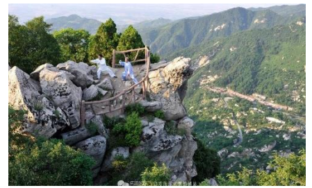
终南山上修行之人