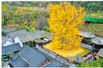
山下观音禅寺千年银杏树