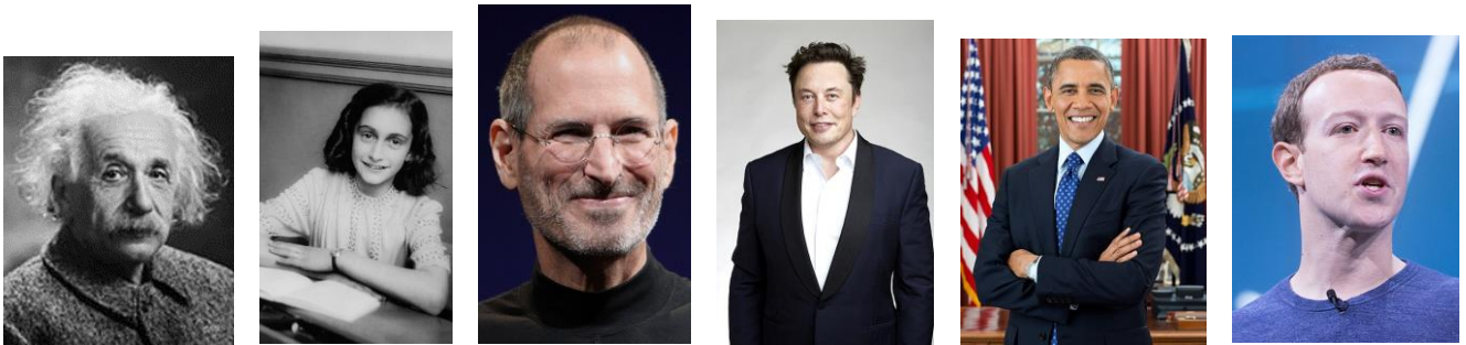
阿尔伯特·爱因斯坦 安妮·弗兰克 斯蒂夫·乔布斯 伊隆·马斯克 贝拉克·奥巴马 马克·扎克伯格