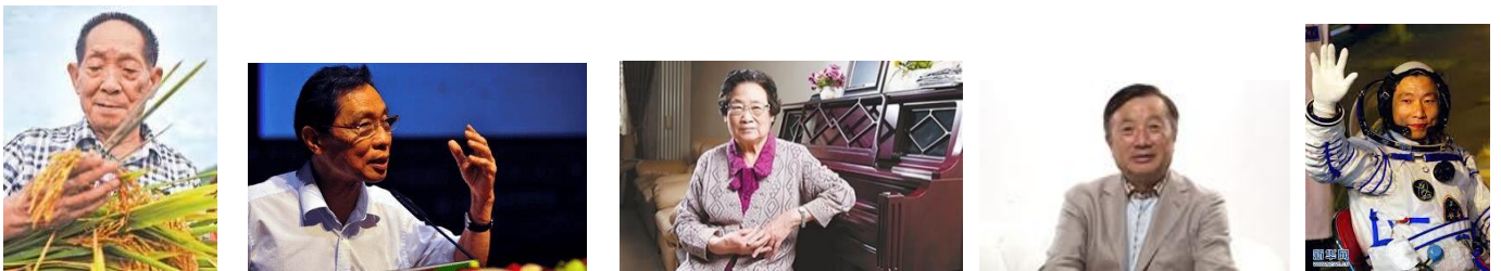
袁隆平 钟南山 屠呦呦 任正非 杨利伟