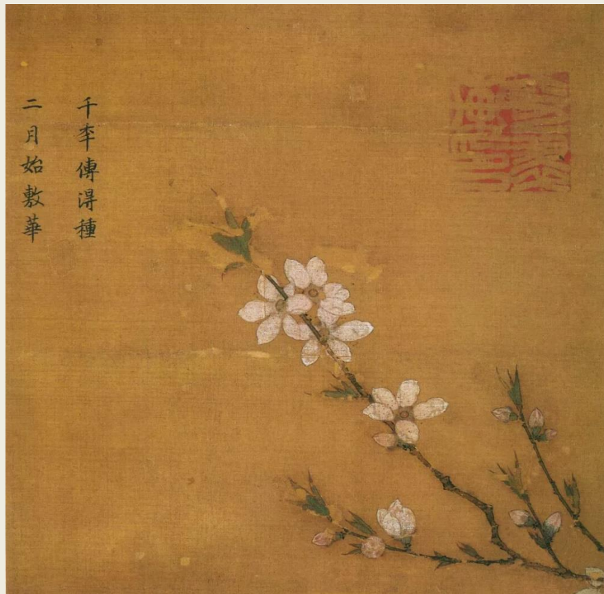
(南宋) 马麟 《桃花图》