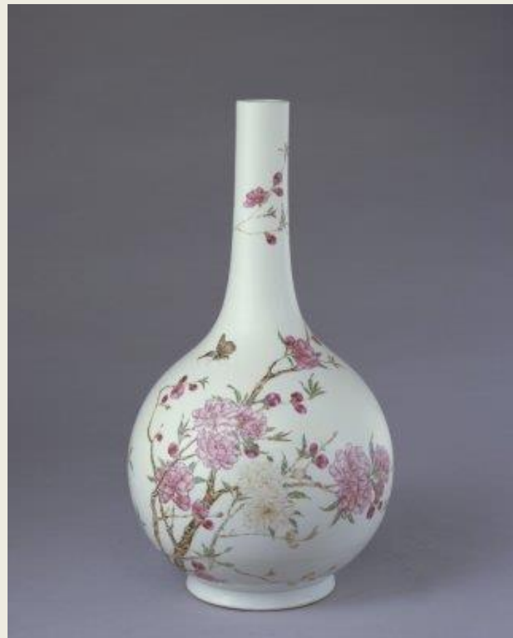
(清) 雍正年间 粉彩桃花纹直颈瓶