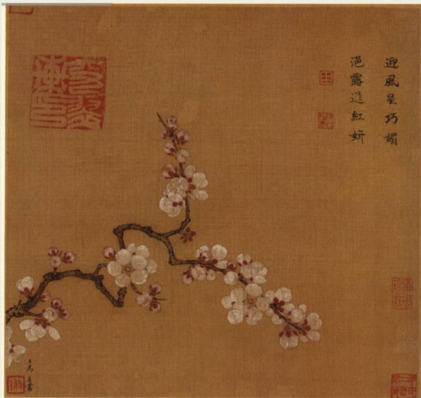
(南宋) 马远《倚云仙杏图》