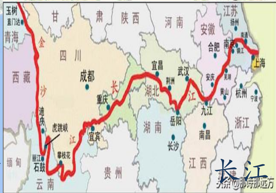
长江 头条@那诗那远方