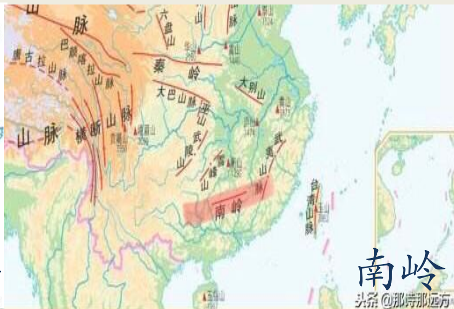
南岭 头条@那诗那远方