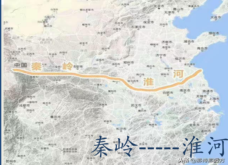
秦岭——淮河 头条@那诗那远方