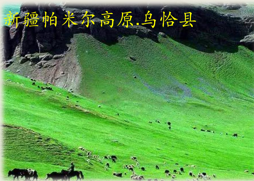
新疆帕米尔高原.乌恰县