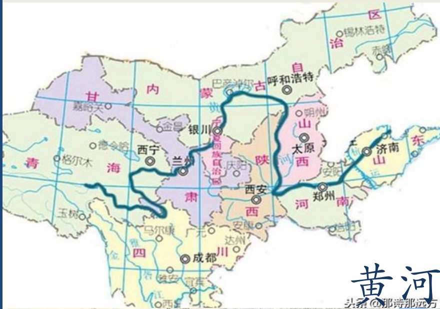
黄河 头条@那诗那远方