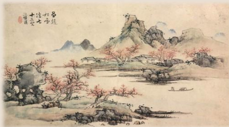
明 蓝瑛《仿古山水册》

邵雍 (1011年—1077年)，字尧夫，自号安乐先生，北宋易学家、哲学家、思想家、教育家。