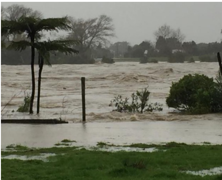
河南郑州洪水 新西兰，Buller river 洪水 (7月假期里发生的事)